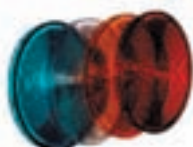
SCHERMI DI SEGNALAZIONI (in dotazione)