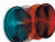
SCHERMI DI SEGNALAZIONI (in dotazione nei modelli IP65)